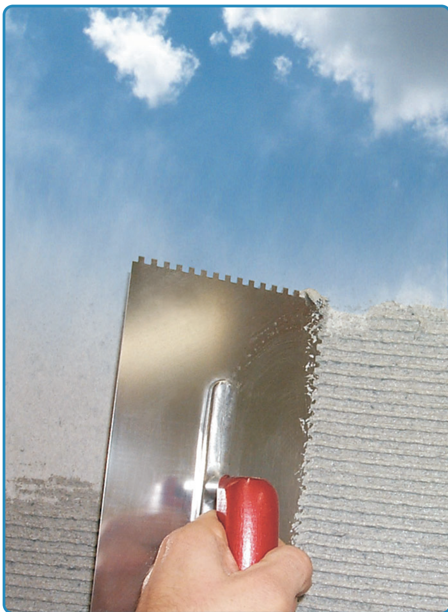
Durch das Auftragen von Meno® mit der Zahntraufel ist die Schichtstärke genau definiert.

Die Grenze zwischen Niederfrequenz und Hochfrequenz ist fließend. Oberhalb von 100 kHz bis zu 300 GHz (100 Tausend bis 300 Milliarden Schwingungen pro Sekunde) spricht man von Hochfrequenz. In diesen Bereichen verschmelzen elektrische und magnetische Felder zu einer elektromagnetischen Welle.