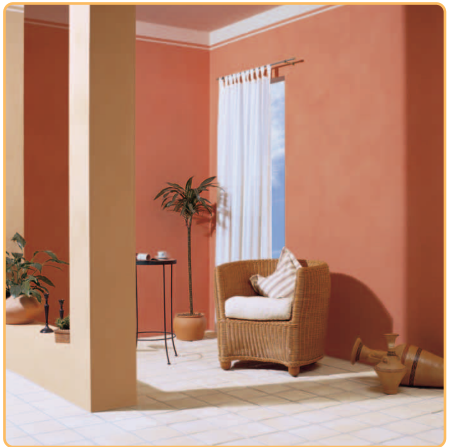
Capriccio – Lehmputz nach Lust und Laune!

Mit dieser Broschüre geben wir Ihnen nützliche Hinweise zur Anwendung von Capriccio.