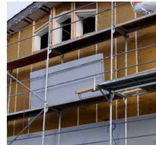
Fassadendämmung außen mit THERMO JUTE DUO, THERMO FASSADE und Putzträgerplatten.