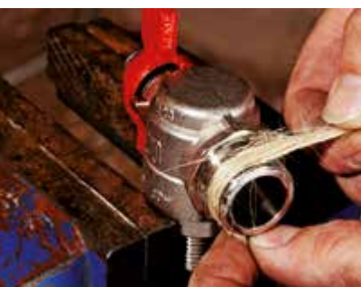
Reißfest und resistent gegen Schimmelpilze – dank Hanffasern.