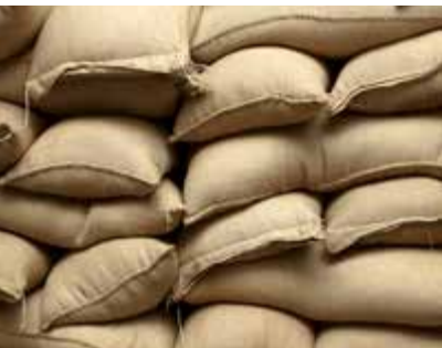
Bereit für ein zweites Leben: Jutesäcke für den Transport von Kakao und Kaffee.

Im Sinne einer erfolgreichen Rohstoffwende, ist unser Ziel, möglichst viele Rohstoffe unendlich wiederzuverwenden. Diesen 100% geschlossenen Produktionskreislauf zu schaffen, ist uns auch bei THERMO JUTE DUO gelungen!