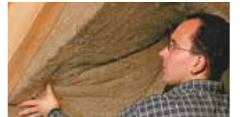
Innenwanddämmung mit großformatigen Matten.