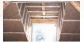
Dämmung eines zum Wohnen ausgebauten Dachgeschosses mit Gaube.